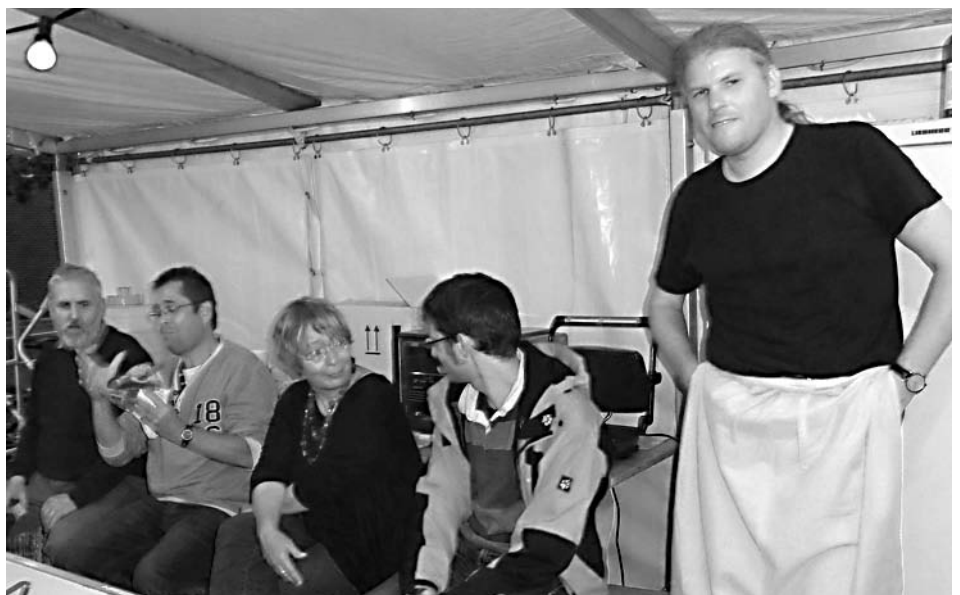
...und nicht zu vergessen, unser Sommerfest auf dem Max-Bill-Platz im Juni. Die Servier-Crew ist bereit, die Gäste fehlen noch.