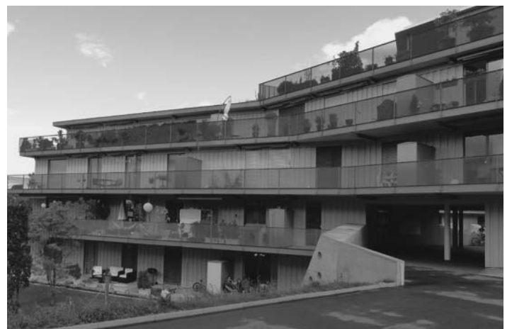
Die Siedlung Wolfswinkel mit grossen Aussenbalkonen.