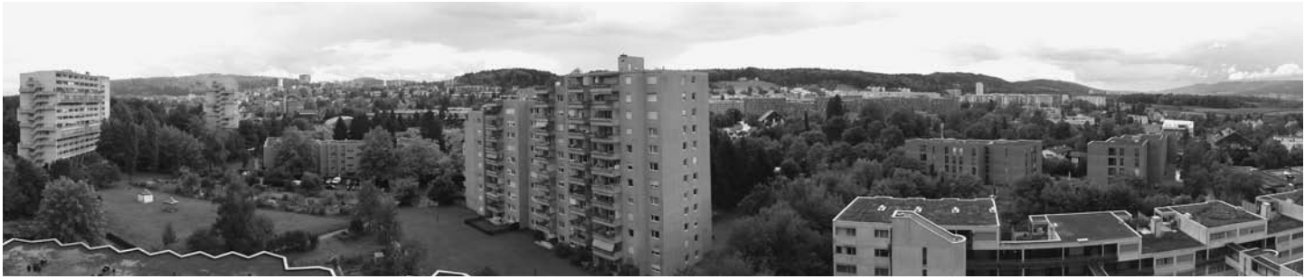
Die Rundschau vom Altersheim Wolfswinkel aus, mit ETH und Regensberg.