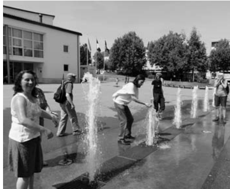
An diesem heissen Hochsommertag ist eine Abkühlung dringend nötig. Darum waren wir in Rümlang froh über diesen Brunnen.