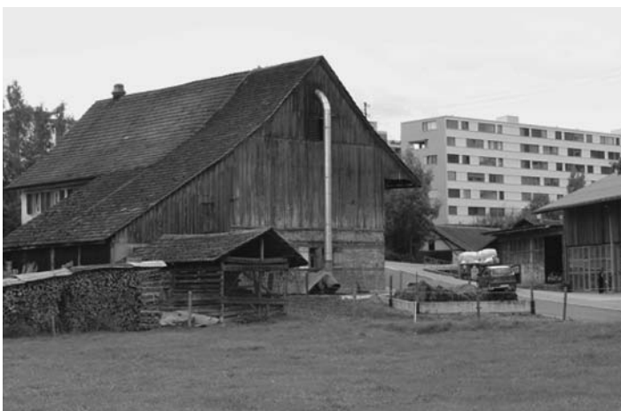
Alt und Neu gleich Nebeneinander.

Ein Problem von Affoltern kündigte sich akkustisch aber schon länger an. Denn die Nordumfahrung von Zürich ist nicht weit und immerzu im Hintergrund zu hören. Nun soll diese Autobahn noch auf sechs Spuren ausgebaut werden.